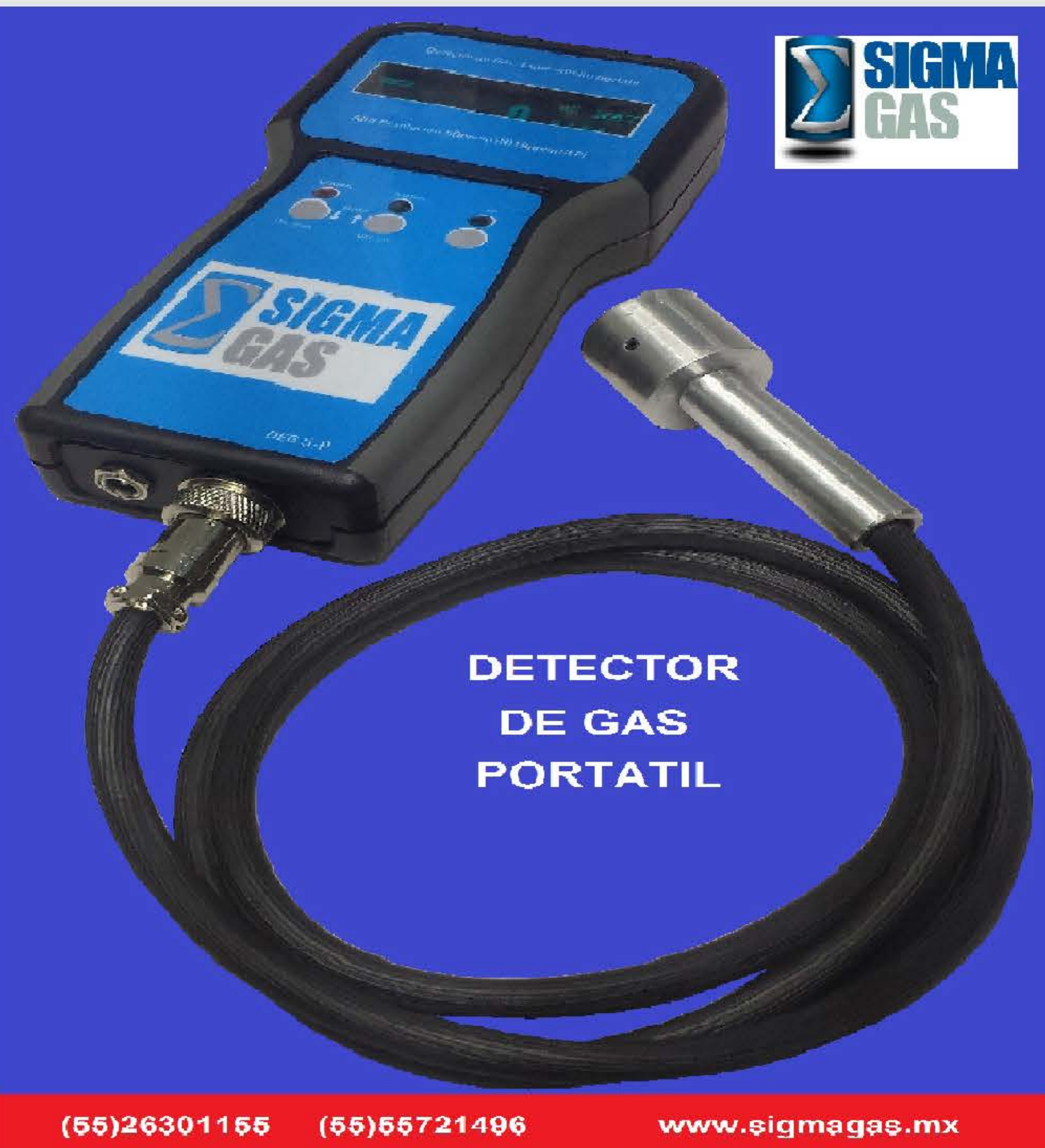
DETECTOR DE GAS PORTATIL

Diseñado para su uso en Empresas e Industrias